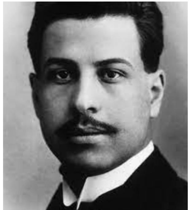
Ramón López Velarde.

Además, se publicarán obras literarias y videos sobre el poeta zacatecano.