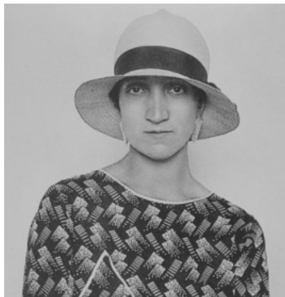
Antonieta Rivas Mercado.

febrero de 2021) para recordar los 90 años de la muerte de la escritora y artista, ocurrida el 11 de febrero de 1931. En su texto, la autora busca trascender la imagen de Antonieta como “la amante” de José Vasconcelos y aborda sus facetas como impulsora del teatro, mecenas de escritores y pieza clave de movimientos políticos de su época, así como su relación con el grupo de los Contemporáneos y el mundo intelectual de su tiempo. “Ya tengo apartado el sitio, en una banca que mira al altar del crucificado, en Notre-Dame. Me sentaré para tener fuerza de disparar”, anotó en su diario un día antes de su muerte.