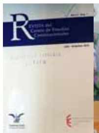
Revista del Centro de Estudios Constitucionales

Revista dedicada a promover e interpretar los derechos humanos conforme a la Constitución mexicana y los tratados internacionales, con una periodicidad mensual, editada por la Fundación Aguirre, Azuela, Chávez, Jáuregui, Pro Derechos Humanos A.C.