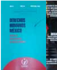
Derechos Humanos México

Órgano informativo que propicia el diálogo entre los principales actores sociales interesados en impulsar el respeto a los derechos elementales del ser humano en el Estado de México; editado por la Comisión de Derechos Humanos del Estado de México.