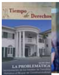
Tiempo de Derechos

Revista dedicada a promover e interpretar los derechos humanos conforme a la Constitución mexicana y los tratados internacionales, con una periodicidad mensual, editada por la Fundación Aguirre, Azuela, Chávez, Jáuregui, Pro Derechos Humanos A.C.