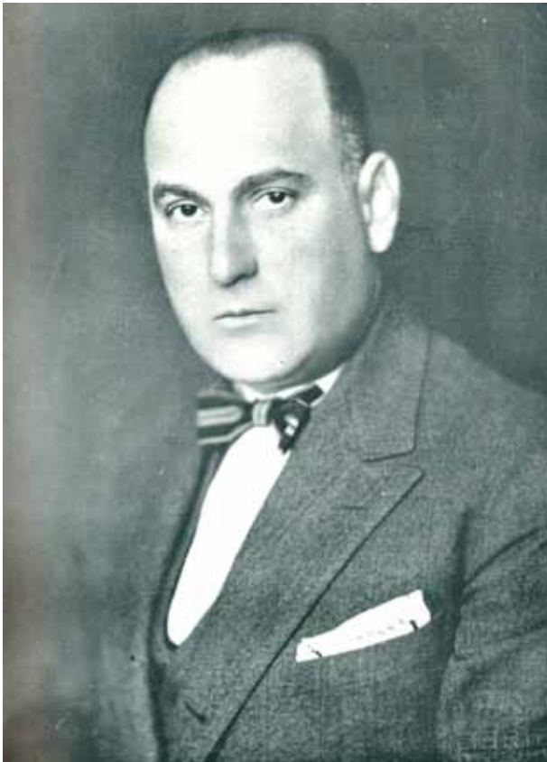
José Manuel Puig Casauranc.

que se constituyó el Distrito Federal en 1824, y hasta 1928, dicha entidad estuvo dividida políticamente en 17 municipalidades. En este contexto, la obra anunció entre sus páginas la nueva estructura política administrativa que tendría el Distrito Federal con motivo de la promulgación que hizo el Poder Ejecutivo, el 31 de diciembre de 1928, de la Ley Orgánica del Distrito y de los Territorios Federales, la cual señalaba a partir del 1o. de enero del 1929 la creación de 13 delegaciones y un Departamento Central. El entonces presidente de la república, licenciado Emilio Portes Gil, designó en la jefatura del Departamento Central al médico José Manuel Puig Casauranc, quien se había pronunciado a favor del régimen revolucionario desde su juventud, ya fuera en puestos de elección popular, ocupando carteras de funcionario público, en su desempeño diplo-