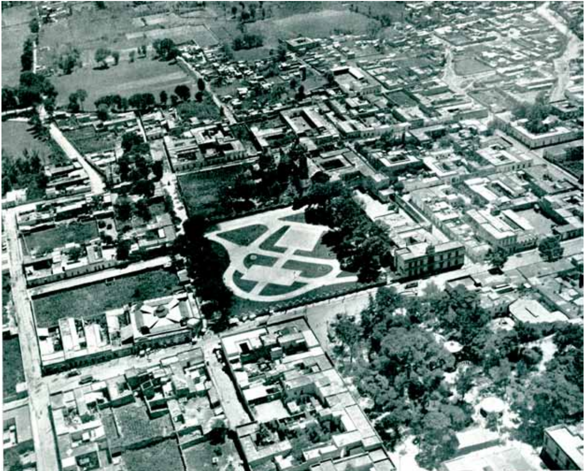
Fotografía aérea de la Ciudad de México.

publicó. El cese en funciones de las autoridades comprometidas con la presente edición frustró que se escribiera este volumen que haría justicia a un tema revolucionario, afín al gobierno nacional de aquel entonces. Pese a ello y, pese a las fallas en términos de la información contenida debido a la premura con la que se facturó la obra, es decir, en tres meses, cabe señalar que el jefe del Departamento del Distrito Federal estuvo orgulloso en todo momento de generar una publicación de esta magnitud y estimuló a los gobiernos de los estados a seguir su ejemplo con la formación de un atlas similar para dar a conocer el devenir de nuestro país en todos sus aspectos.