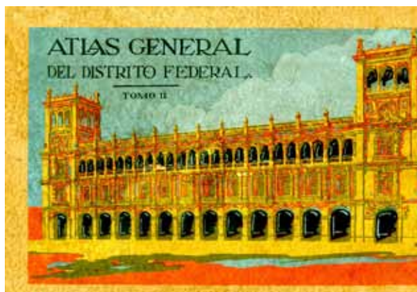
Atlas general del Distrito Federal, tomo II. México: Talleres Gráficos de la Nación, 1930.

Si bien se desconoce su tiraje, seguramente tuvo en su tiempo una buena aceptación y distribución, en virtud de que se considera la obra cumbre de ese periodo sobre el tema. Por su valor bibliográfico, hay en resguardo varios ejemplares disponibles para su consulta en los repositorios