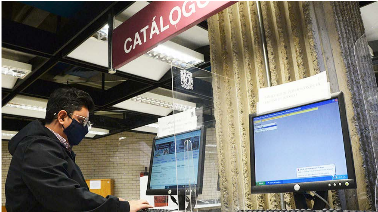
Un usuario consulta los catálogos de la BNM.

la Biblioteca de la Facultad de Filosofía y Letras (UNAM), la Biblioteca del Instituto de Investigaciones Jurídicas (UNAM), la Biblioteca Histórica José María Lafragua y la Biblioteca de la H. Cámara de Diputados.